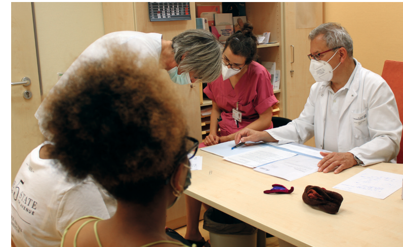
In der Spezialsprechstunde des SAIDA Kompetenzzentrums